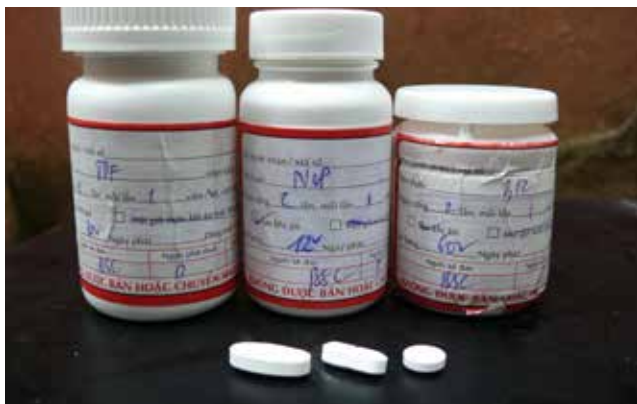
Một số loại thuốc ARV bậc 1

CÂU HỎI 11: Người có thẻ BHYT khi bị nhiễm HIV, có mua một số thuốc điều trị ARV, đã tập hợp đầy đủ chứng từ để nghị thanh toán BHYT thì có được thanh toán số tiền thuốc trên không?