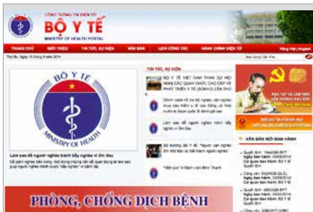
Website của Bộ Y tế - www.moh.gov.vn

Danh mục thuốc ban hành kèm theo Thông tư số 31/2011/TT-BYT ngày 11/7/2011 và Thông tư số 12/2010/TT-BYT ngày 29/4/2010 của Bộ Y tế, Bạn có thể tham khảo trên Website của BHYT ( http://www.moh.gov.vn ). Ngoài ra, mỗi cơ sở y tế đều có danh mục thuốc được cấp có thẩm quyền phê duyệt và được công khai tại cơ sở y tế đó.